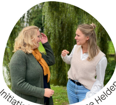
Initiatiefnemers Dordtse Helden